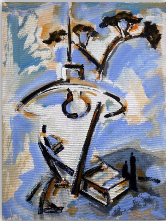
« Lumière bleue » V. KARA Acrylique sur toile 80X60