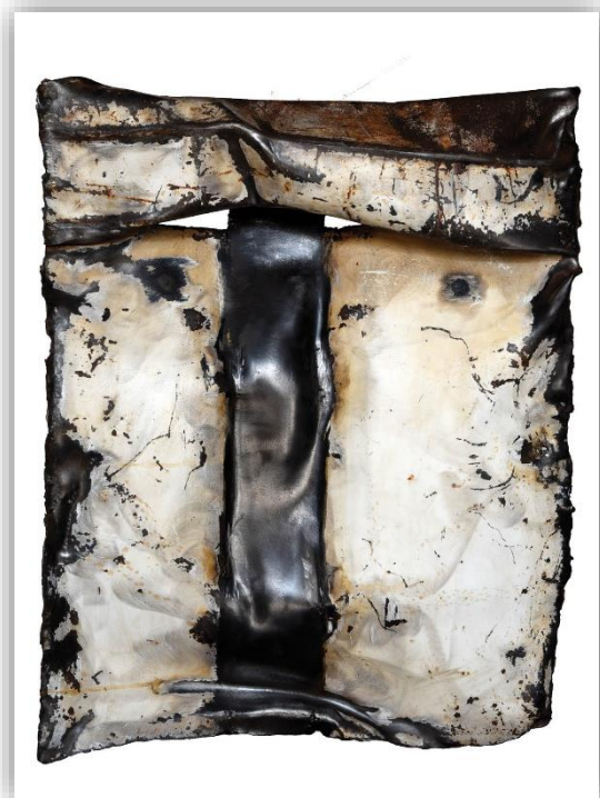
« Beauté mon œil /35 » O. FRÉMONT Sculpture métal 70X60